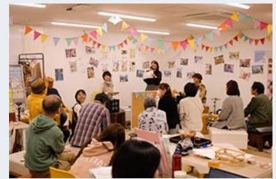
まちなか交流拠点「マチノマ」