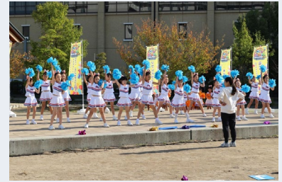
キセラ川西せせらぎ公園(キセラ川西内)