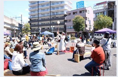
藤ノ木さんかく広場