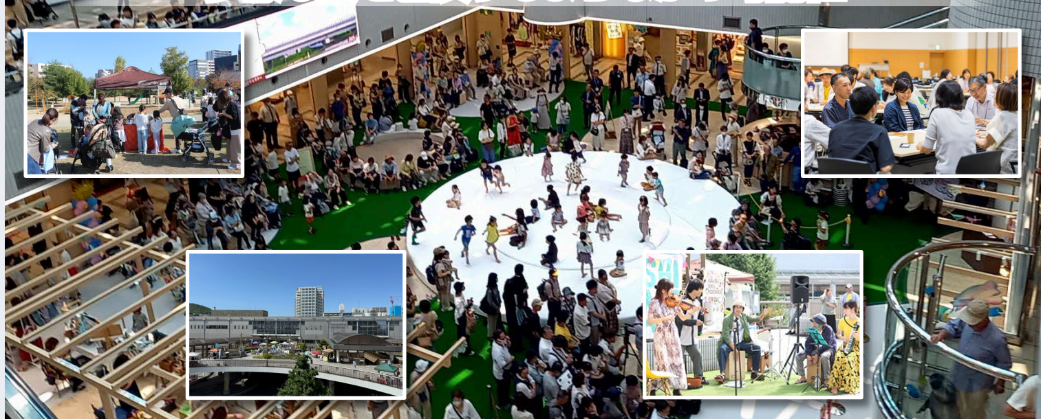
※背景写真:アステ川西びいばう広場 / 枠内写真:左から キセラ川西せせらぎ公園、川西能勢口駅前デッキ、ペDESTリアンデッキでのイベント、LOCAL BUSINESS HUB かわにし